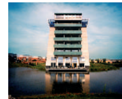
APPARTEMENTENTOREN IN NIJKERK: ÉÉN IN ZIJN SOORT